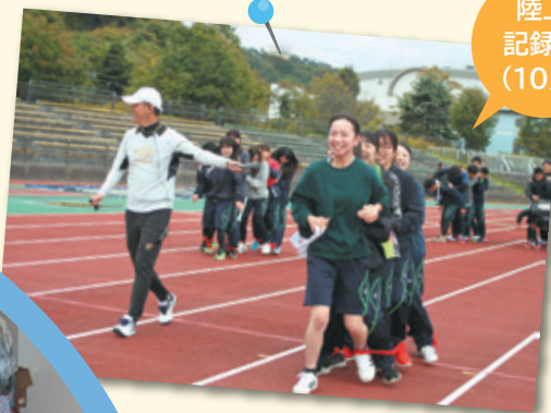
陸上 記録会 (10月)