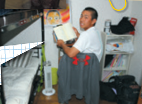
野球部の寮では9人が生活しています。通学時間を練習に充てたいと地元の生徒も入寮しています。

AUSTRALIA CAIRNS Atherton State High School