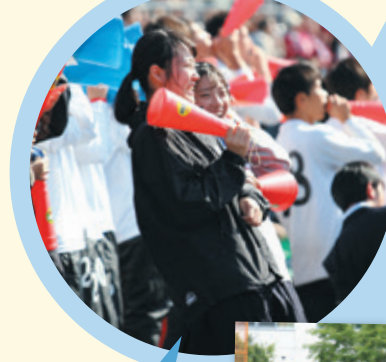
↑ サッカー 全校応援!! 野球 →