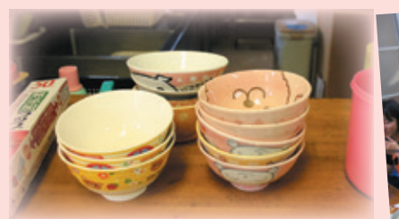
女子サッカー部の寮は校舎から徒歩20秒!?二人部屋、三人部屋で仲良く生活しています。寮の宿泊体験もできます。