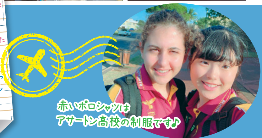
赤いポロシャツは アサートン高校の制服です!!