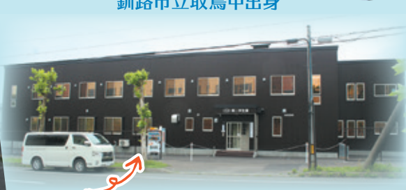
新築の寮があります。いずれも学校の近くです。