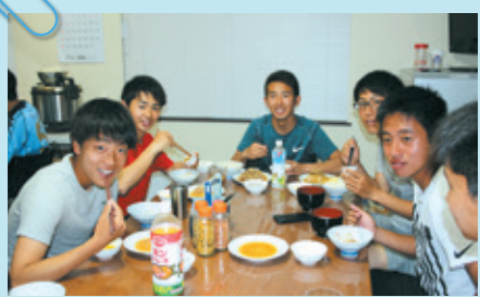
男子サッカー部には、ハ丁平にある現在の寮と